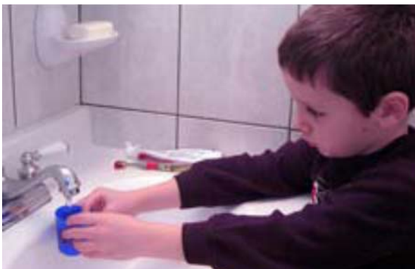
Remplir le gobelet avec de l'eau