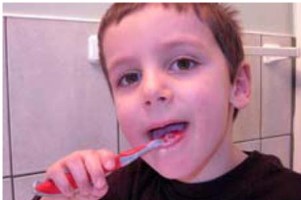
Brosser la rangée de dents du bas