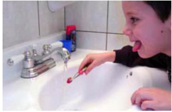
Mouiller la brosse