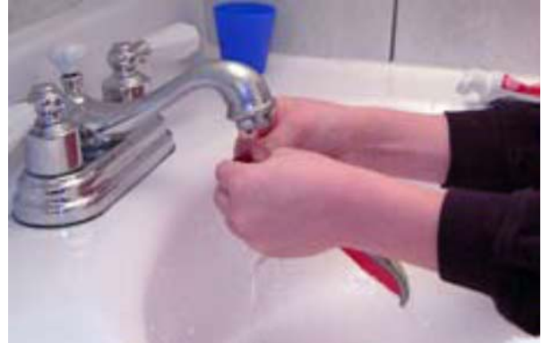
Rincer la brosse