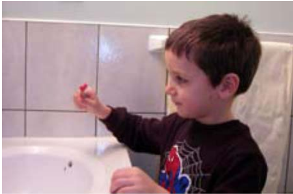
Prendi lo spazzolino