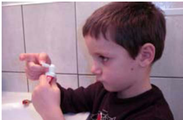
Togli il cappuccio dal tubetto di dentifricio