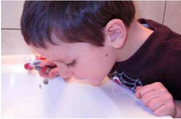
Nhỏ nước đánh răng trong miệng