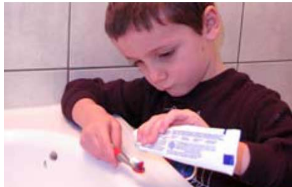
Bôi thuốc đánh răng lên bàn chải